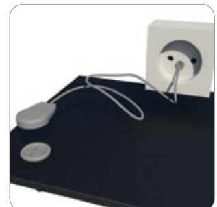
Abb. 3: 051SFG0200 Ringförmiges Endstück