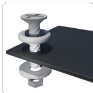
Abb. 1: 051SCP0200 Anschlussverschraubung