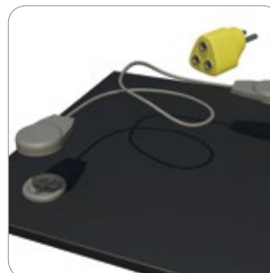
Abb. 2: 051SFG0100 (weibliche) Druckknopfungung